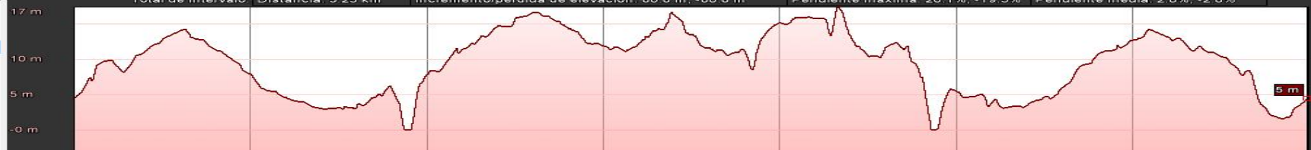
Gráfico: min., media, máx. Elevación: -0, 10, 17 m Total de intervalo: Distancia: 5,25 km Incremento/pérdida de elevación: 80,8 m, -80,8 m Pendiente máxima: 20,1%, -19,5% Pendiente media: 2,8%, -2,8%